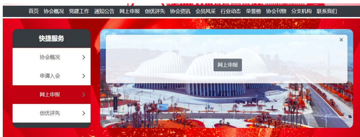
图 2 选择“网上申报”进入申报系统

二、选择“快捷服务”栏目上的“网上申报”，进入广西建筑业联合会项目申报系统。（如图 2）。