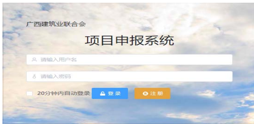
图 3 项目申报系统登录界面

四、公司首次登陆系统需先点击“注册”进入页面填写完成相关信息，注册成为项目管理员。登录名可采用汉字或字母，建议采用字母；密码应不少于 8 位，且应含有字母、数字和特殊字符。填写完成后点击“注册企业管理员并提交审核”，由广西建筑业联合会审核后方可正式登录使用系统。每个公司只有一个企业管理人员账户。分公司账户须由总公司管理员生成后分配使用（分账户的初始密码为：12345678），分公司账户遗忘或丢失密码则需要由总公司管理员复位密码。